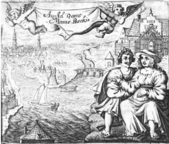
Amstel Dams Minne Beekje