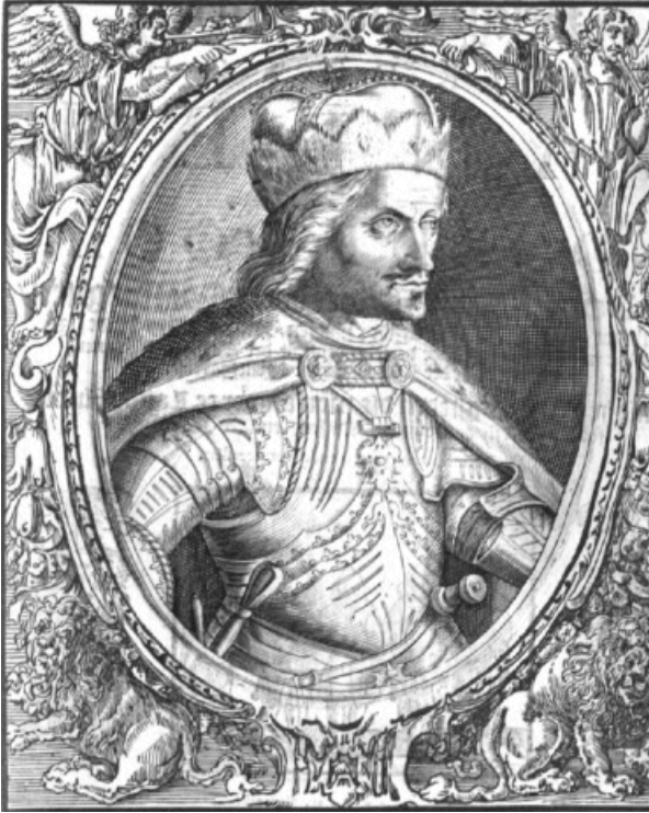
Fredericus de III. Koningh van Deenemarken.