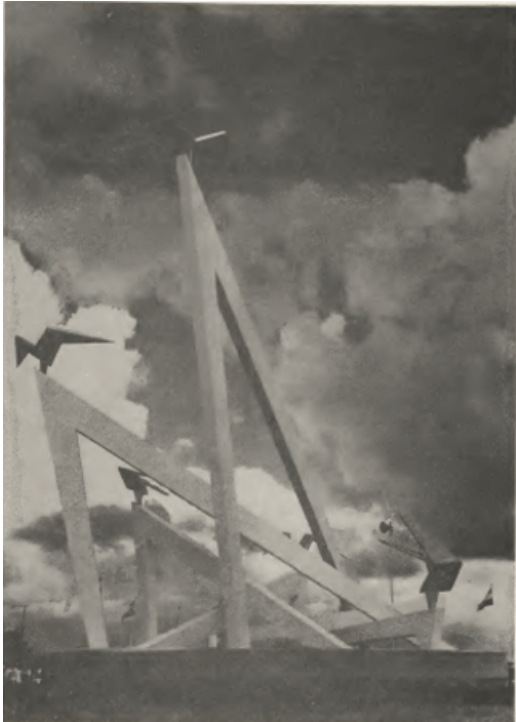
Het Autonomie Monument...