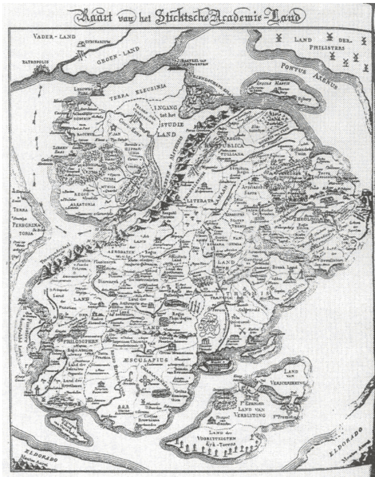
Kaart van het Stichtsche Academie-Land in de Utrechtsche Studenten-Almanak van 1834.