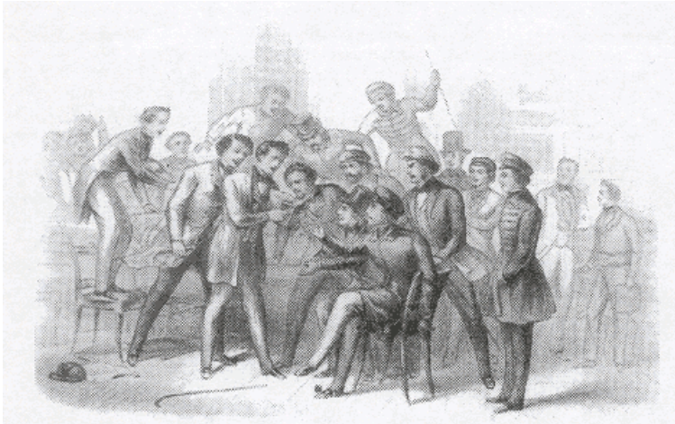
O. Veralby (Alexander Ver Huell), 'Het eerste exemplaar van den nieuwen almanak op de sociëteit'. Illustratie uit de Leidsche Studenten-Almanak van 1841 (gereproduceerd uit De Werken van Alexander Ver Huell ).