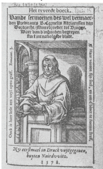
Titelpagina van het tweede deel van de Historie van B. Cornelis, uit 1578

hand gaan waarin toespelingen worden gemaakt op Broer Cornelis' geselpraktijken in het verleden, wordt zijn reactie als volgt verwoord: 'Den 26. Decembris was 't met B. Cornelis wederomme alzo afgrijselijk en gruwelijk te roepen, te tieren, te schreemen [= schreeuwen], te stampen, te smijten [= slaan], te spartelen en te springen in zijnen predikstoel dat de honden op hem gingen staan bassen [= blaffen].'