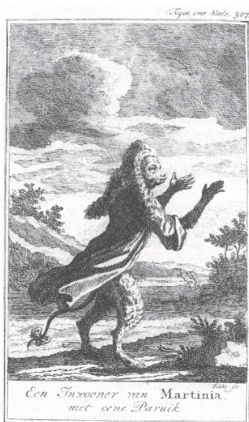
Beschaafde aap, burger van een binnenaards land. Ill. uit De onderaardsche reis van Claas Klim (1741), door Holberg.

Is niet alles welgereegeld en gelukkig op dit Eiland, daer de mensch, de algemeene harmony der Schepping, nog nimmer kwam verstooren? Ben ik hier niet vry en onafhanklyk; zonder andere Wetgevers te erkennen, dan God en de Natuur, wier wetten de trouwe bewaerlieden zyn, van myn geluk? 41