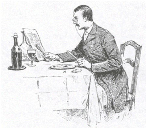
Lezen en eten (uit: Van der Meulen, Het Boek in onze dagen )

Vanaf de jaren veertig kunnen wij dus een groei van de boekhandel vaststellen, die werd gestimuleerd door een daling van de prijzen. Hoewel dit een geleidelijk proces was, kunnen we toch een tweede versnellingsfase aanwijzen, namelijk de jaren tachtig, toen papierfabrieken houtpulp als grondstof gingen gebruiken en rotatiepersen werden ingevoerd voor het drukken van kranten. Het waren opnieuw de kranten, met hun grote behoefte aan snelle en grootschalige productie en geringere aandacht voor de kwaliteit van het geproduceerde drukwerk, die de eerste aanzet gaven tot deze vernieuwingen.