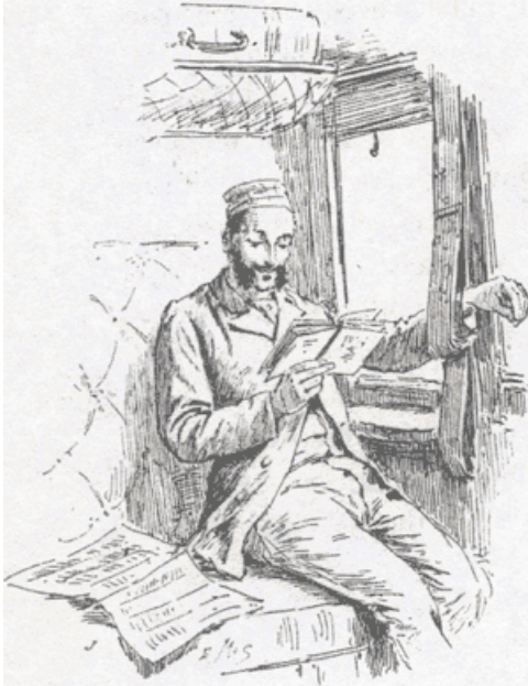
Lezen in de trein (uit: Van der Meulen, Het Boek in onze dagen )

Een tweede hypothese ontleen we aan de opvatting van Karl Marx dat industriële ondernemers nieuwe machines invoerden als wapens in de klassenstrijd. 12 Door de productie te mechaniseren konden minder geschoolde werklieden worden aangesteld, met name vrouwen en kinderen, die de helft of minder van het loon van een volwassen man verdienden. Bovendien kon de arbeidsdag worden verlengd en kon het arbeidstempo worden opgevoerd