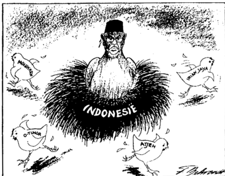
De Telegraaf , 2 september 1999