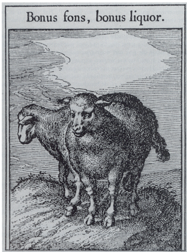
afb. 3 Bonus fons, bonus liquor (II,35)