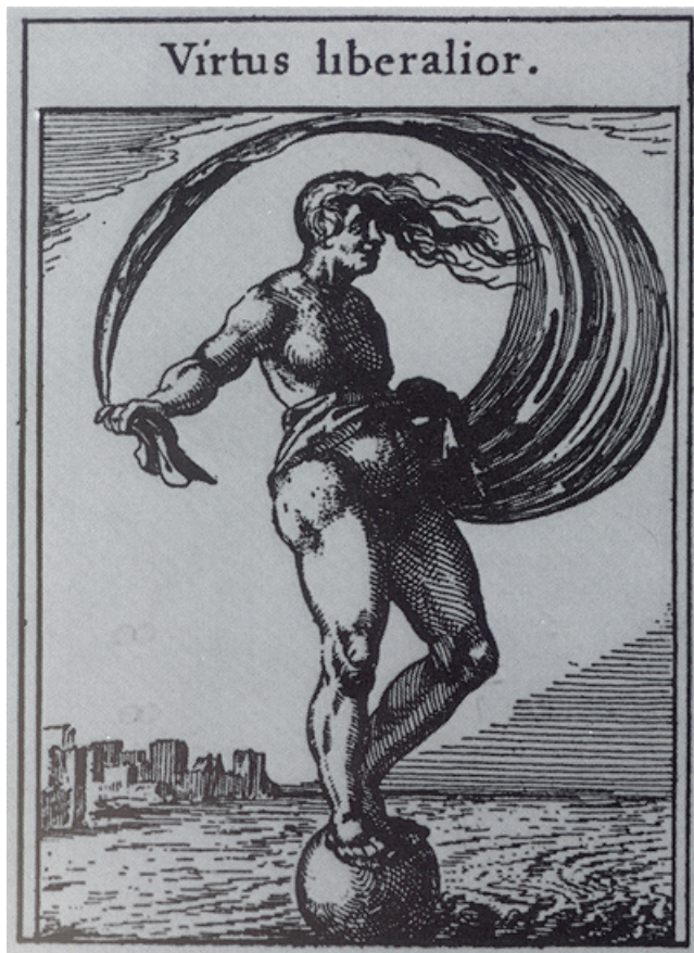
afb. 2 Virtus liberalior (III,55)