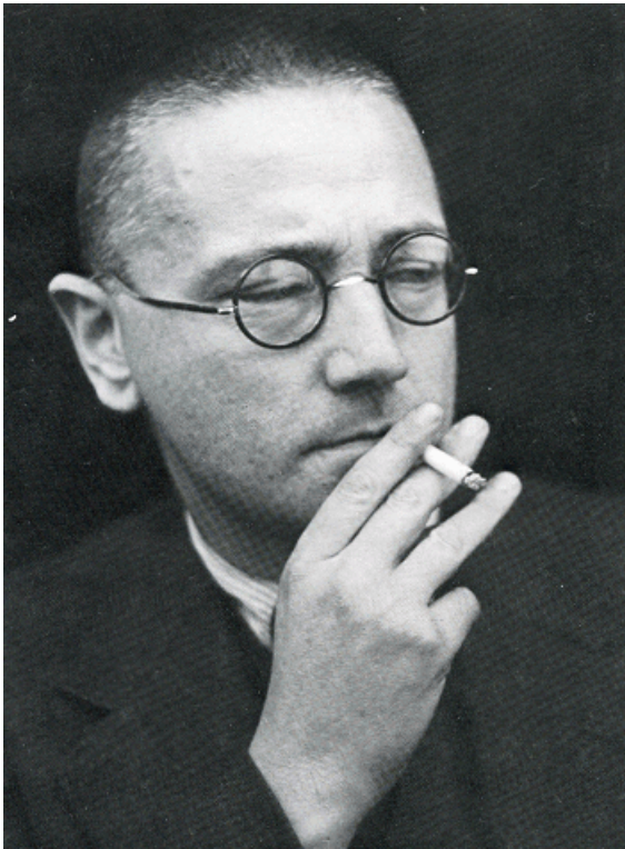
S. Vestdijk, 1939