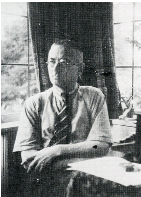
S. Vestdijk, ca. 1945