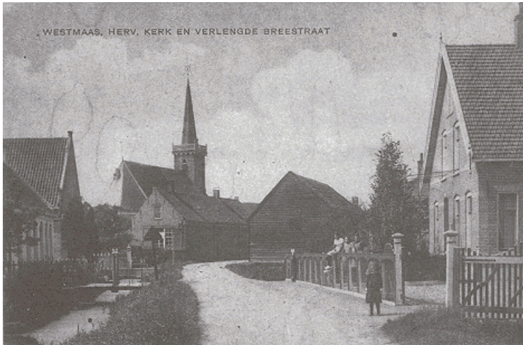
Oude ansichtkaarten van Westmaas, dat model stond voor Mastland. De Verlengde Breestraat heet thans Munnikenweg. Vlakbij de plek waar deze foto uit 1918 genomen is staat nog steeds de pastorie. (Historisch Documentatiecentrum voor het Nederlands Protestantisme 1800-heden)