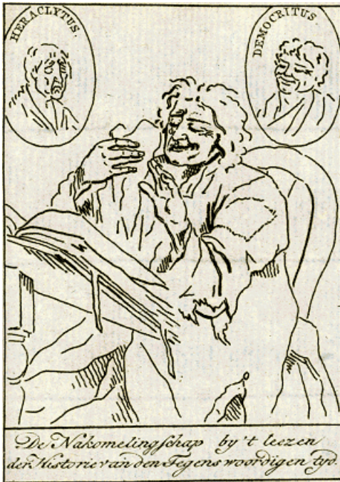
De Nakomelingschap by 't leezen der Historie van den Tegenswoordigen tyd.