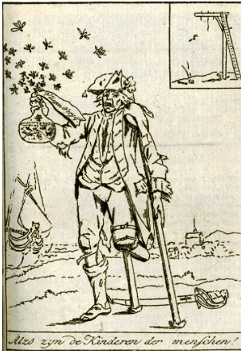
Alzo zyn de Kinderen der menschen